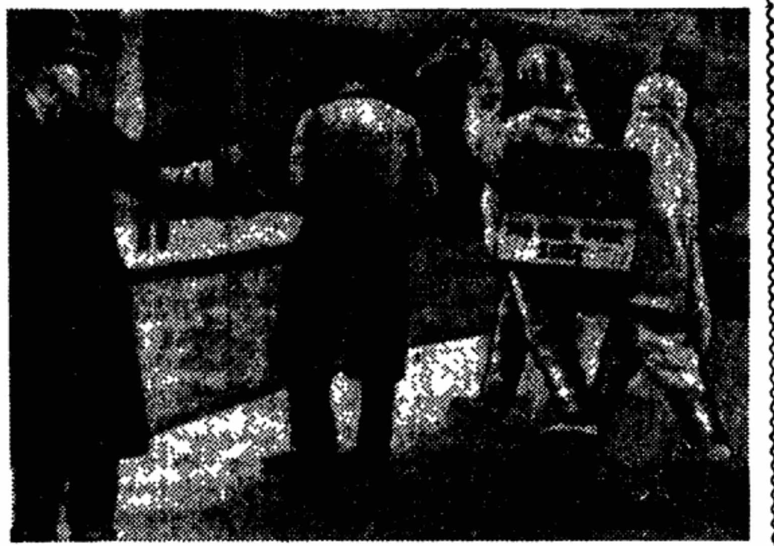
Лондонская полиция запретила английским сторонникам мира распространять в центре города листовки с призывом к мирному урегулированию суэцкого вопроса. Тогда на улицах Лондона появились запечатленный на этом фотоснимке «верблюд», несущий плакат: «Из-за тори мы нажили горби. Не надо войны из-за Суэца».